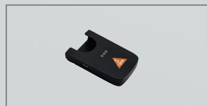
Boîtier de chargement CC1 [02]