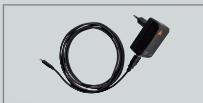
Bloc d'alimentation E4-USBC avec câble [04]