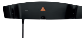
Cargador de pared CW1 [05]