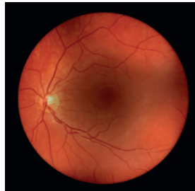
Vista de una retina a través de una catarata con visionBOOST**

Hasta ahora, cuando el frente del ojo estaba cubierta por opacidades en los medios (como por ejemplo cataratas), la retina no se podía ver o esto solo era posible de forma limitada.